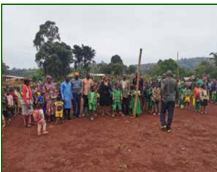
Descente au complexe scolaire de Bamelo