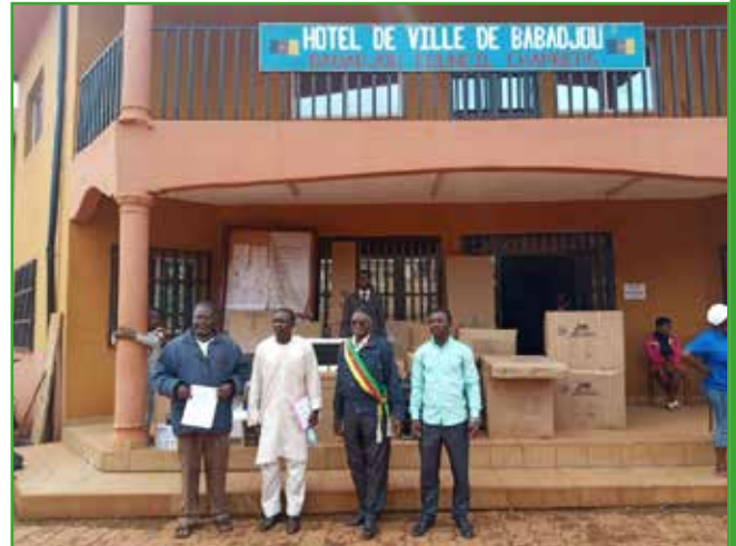
CEOCA : création d'un bureau d'emploi Municipal (BEM)