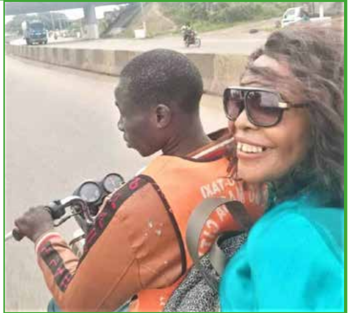
A bord d'une moto , madame le Maire fait une descente sur le terrain