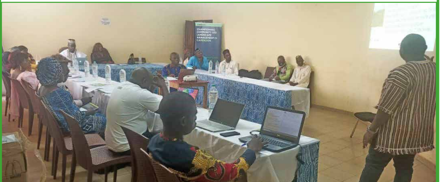
Le Maire, présidente du comité de gestion du paysage des Mont-Bambouto