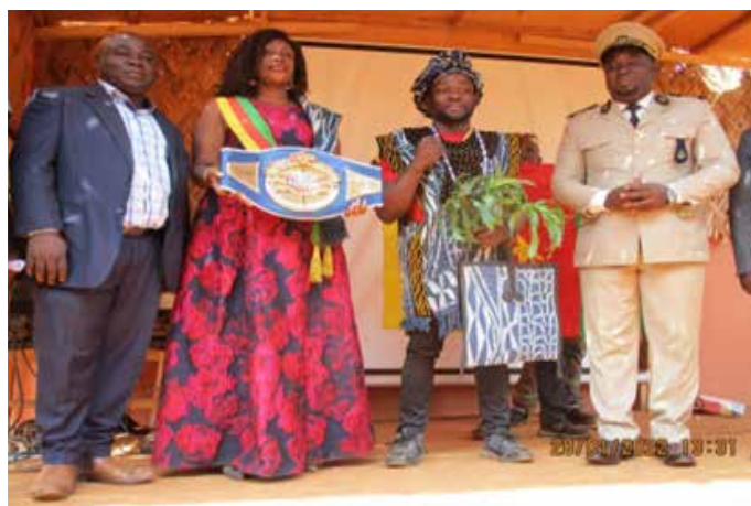
RECEPTION DU DIGNE FILS BABADJOU FRANCIS TCHOFFO CHAMPION DU MONDE POIDS MOYEN