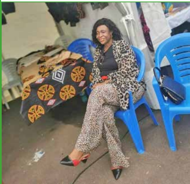
Foire exposition du génie Africain du 28 au 30 novembre 2021 : le maire visite le stand des artisans de Babadjou