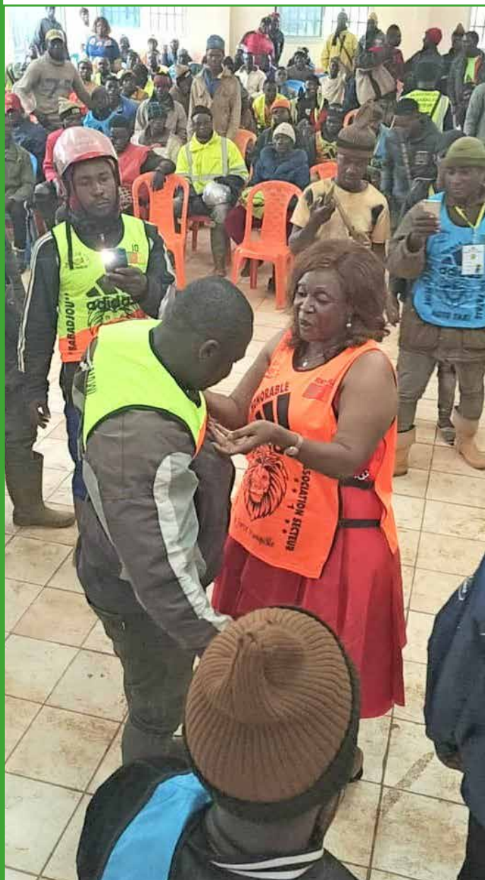
Le maire habille de chasubles les moto taximen exerçant à Babadjou