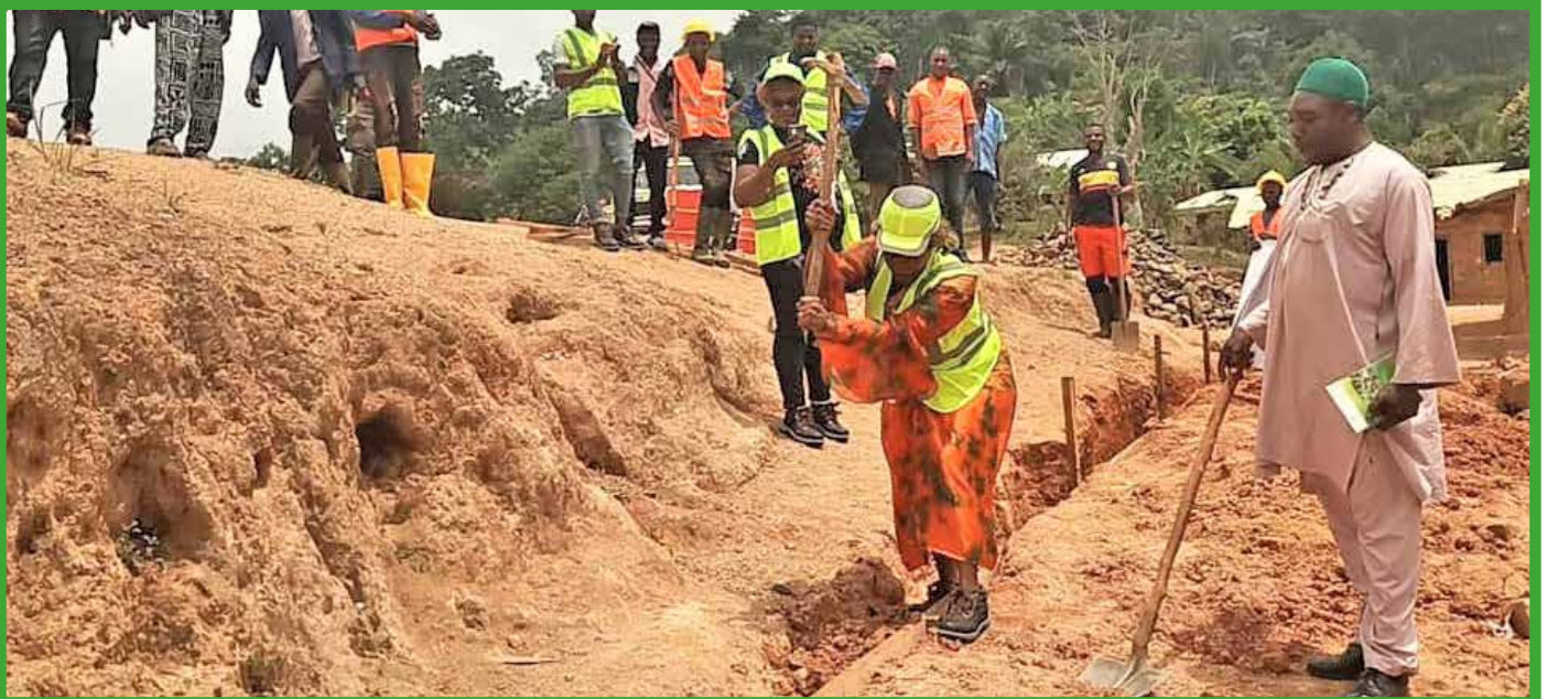
Le maire à l'œuvre pour le lancement des travaux de construction d'un bloc de 2 salles de classe «école de mes rêves» à l'EP de Bamepa'ah