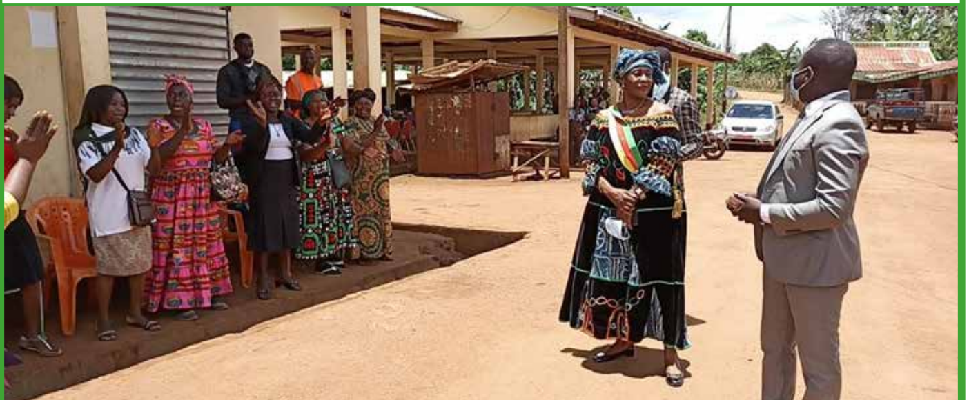
Inauguration de six (06) boutiques, un (01) bloc latrine et un (01) hangar au marché Balepo