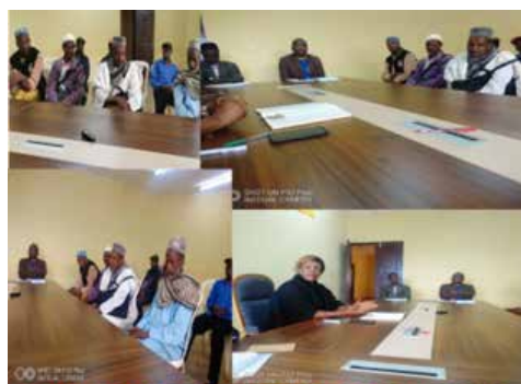
REUNION AVEC LES CHEFS ET LEADERS ISSUS DES 3 VILLAGES BORORO DE LA COMMUNE

Effectue quotidiennement de multiples réunions de concertation :