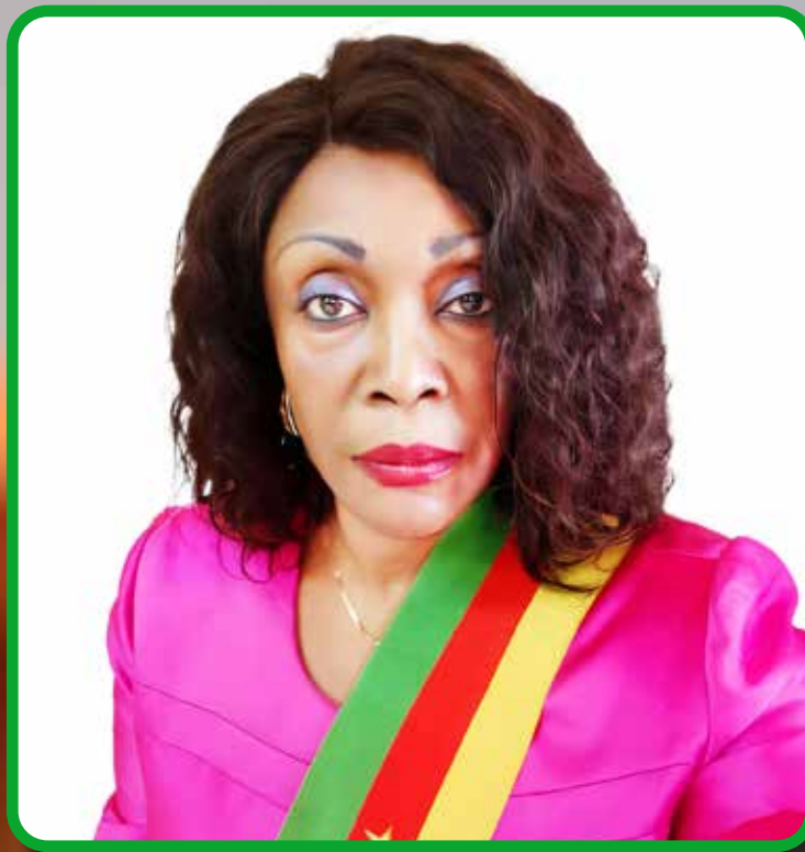
GISÈLE TSANGUE MAIRE DE BABADJOU