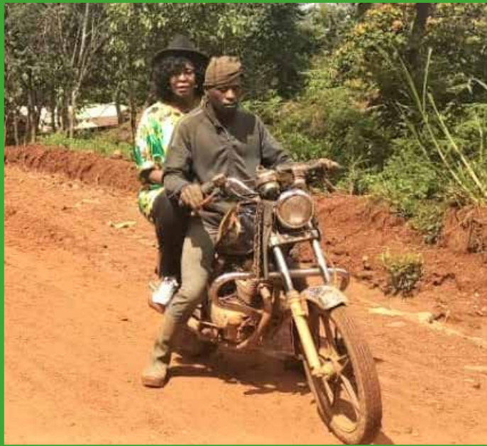
Même à moto lorsque l'objectif doit être atteint