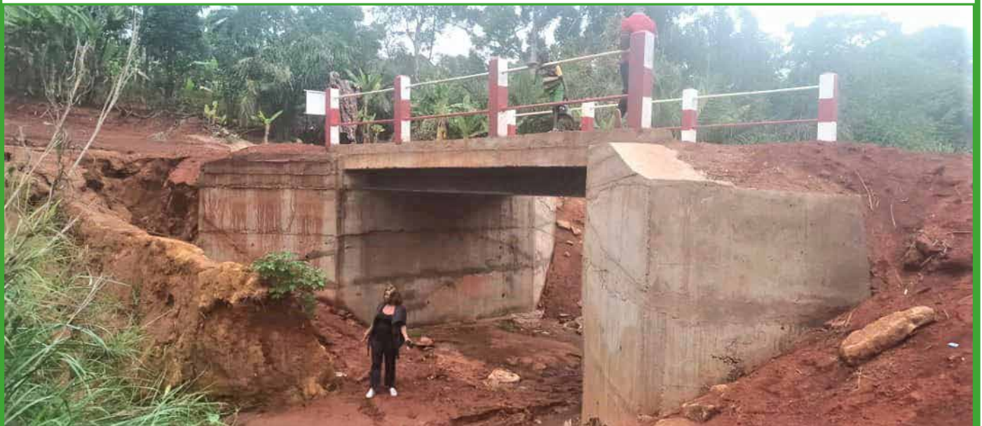
Descente des chantiers, c'est sa passion