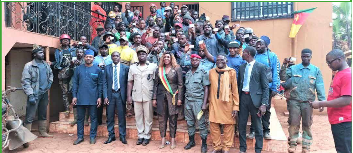
Distribution des permis de conduire