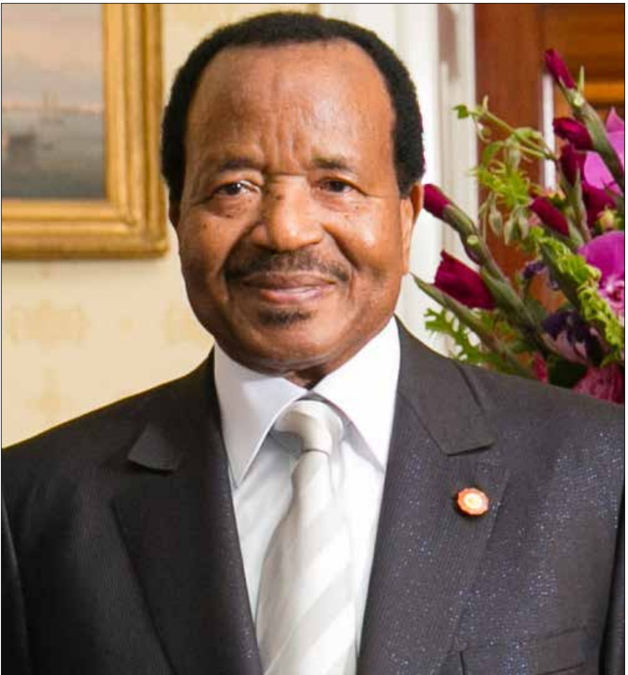
S.E. M. PAUL BIYA, PRÉSIDENT DE LA RÉPUBLIQUE DU CAMEROUN