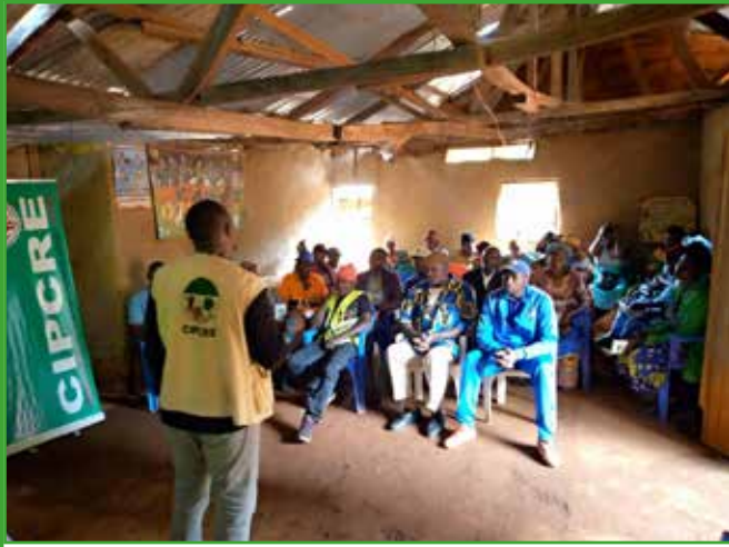
Convention CIPCRE-Commune de Babadjou : volet social à Bamegnia