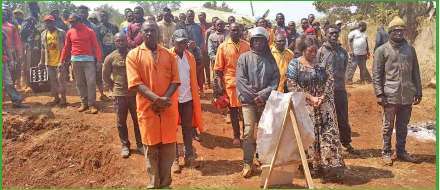
Madame le maire au chevet de la famille d'un mototaximan décédé par accident