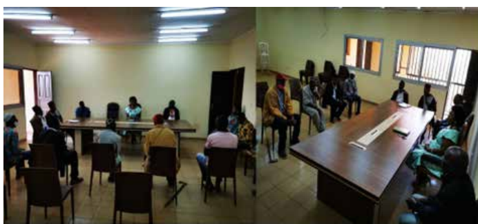
CONCERTATION AVEC LES CHEFS DE BLOCS

La commune de Babadjou est ouverte à tous. Elle est à l'écoute de ses populations. Elle va à la rencontre des chefs de blocs des villages, des jeunes dynamiques des villages Babadjou, de la diaspora des états unis d'Amérique, des populations Bororo de la Commune de Babadjou, des vigneron, des populations Mbafung de Maroua, des jeunes des associations (CSI, JAB, JABI, LEUNG BASSO de Yaoundé), des membres de l'association des femmes et filles Bamboutos de Yaoundé.