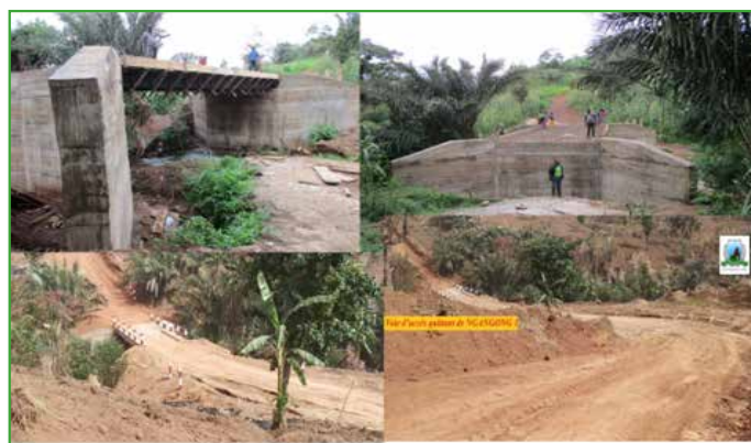
PONT SUR LA RIVIERE TCHI NGANGONG