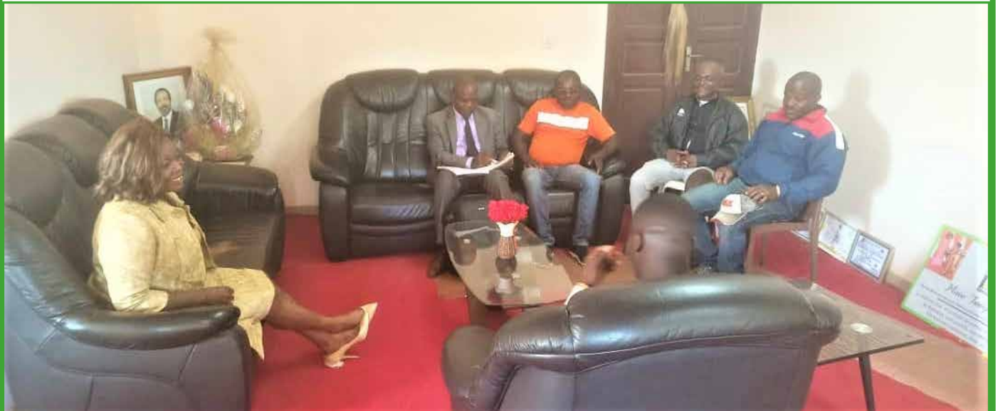
Rencontre avec le bureau du comité de développement de Balepo