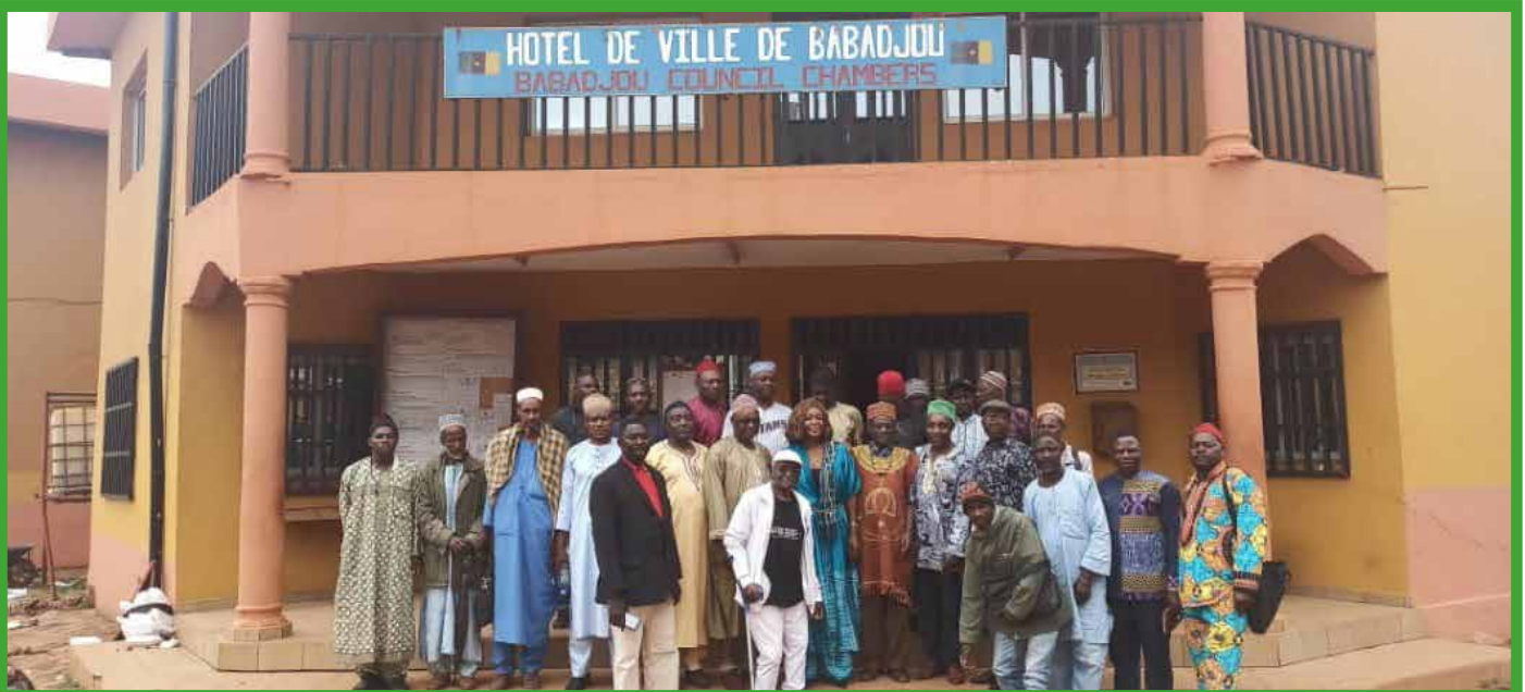
Le maire et les chefs de village, oreilles de la population