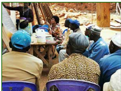
Cellule de planification du PCD au village Bamelo