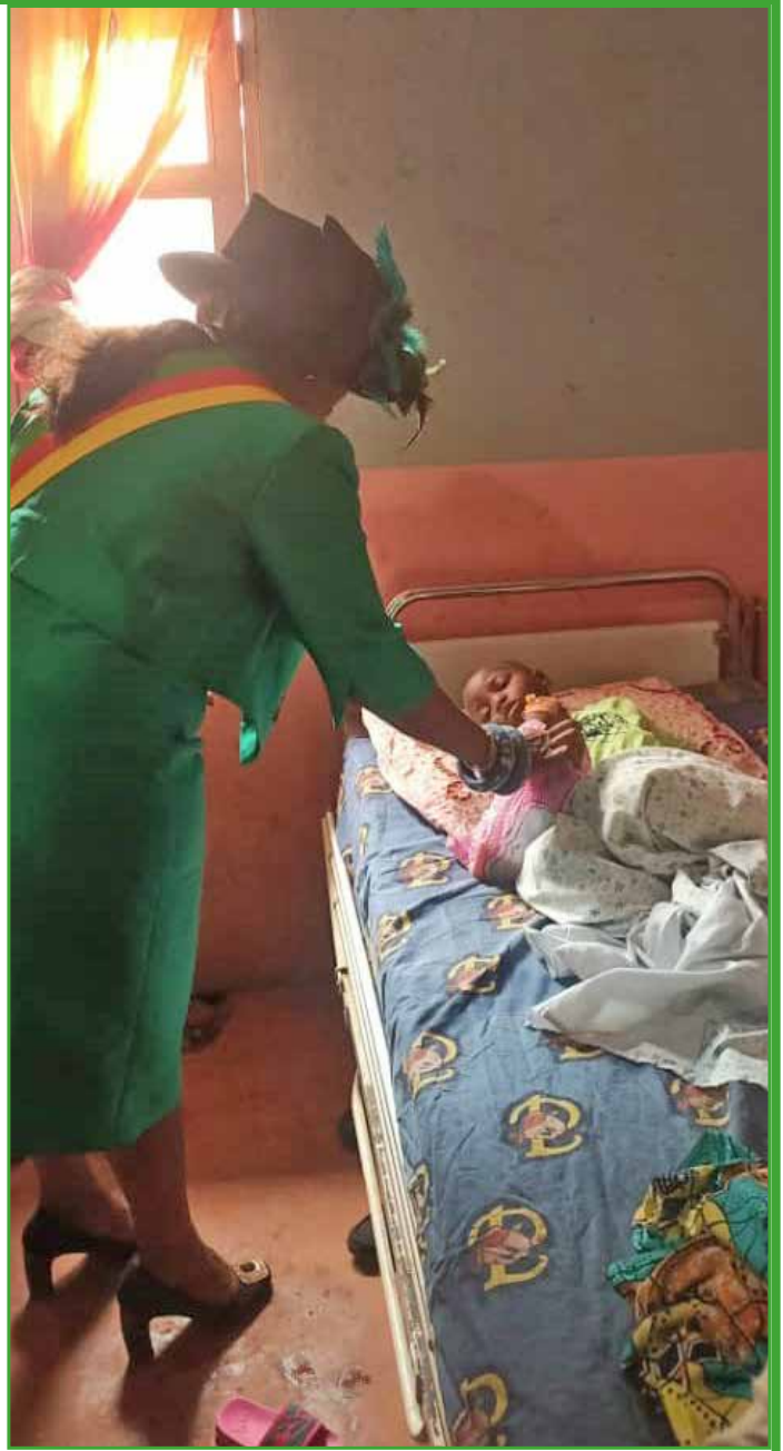
Toujours au chevet des malades