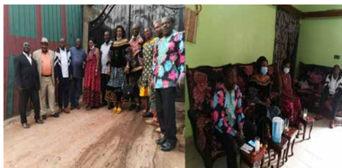
RENCONTRE AVEC LE BUREAU DU COMITE DE DEVELOPPEMENT DE BAMETOGOUNG

Effectue quotidiennement de multiples réunions de concertation :