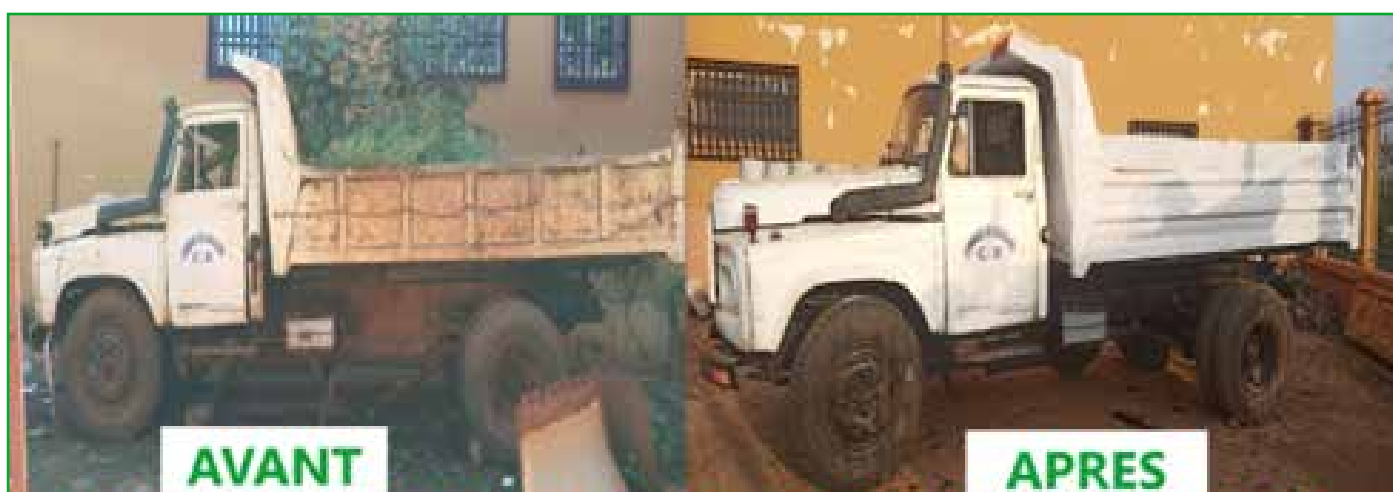
Réhabilitation sur fonds propres 2022 du camion benne de la Commune de Babadjou