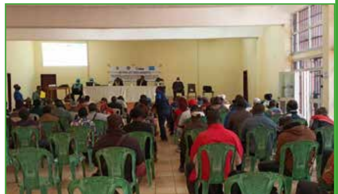
RHEMA-CARE-Commune de Babadjou : projet EduGrant