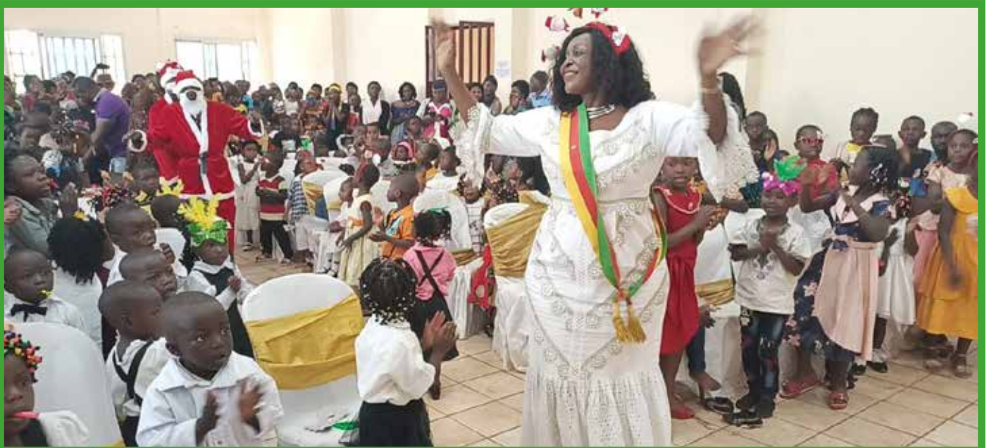
La population, jeunes et les enfants : une histoire d'amour pour le maire