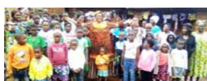
VISTE À LA CHEFFERIE MANTSEIT