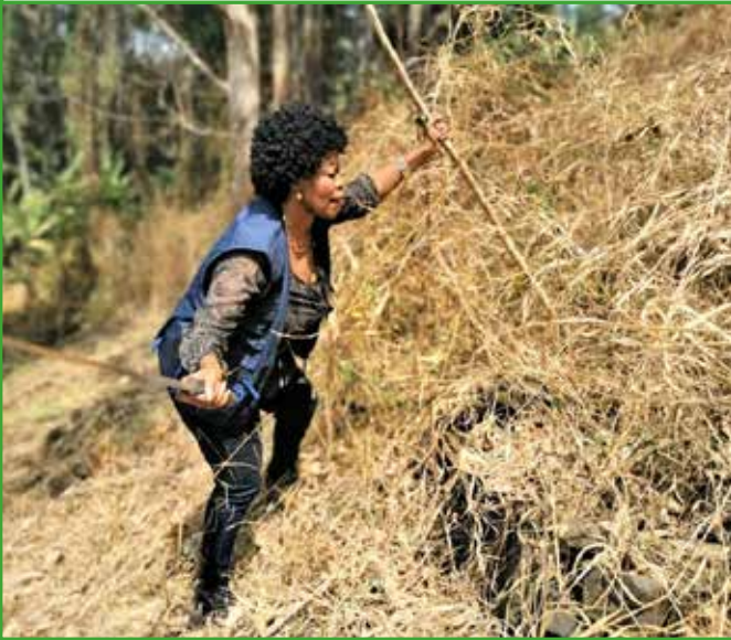
À la guerre contre les feux de brousse qui menacent de bruler la chefferie de 1er degré chaque saison