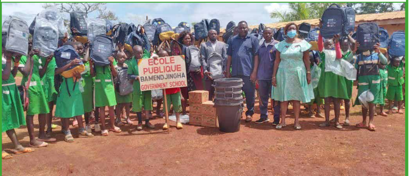
Coopération ASCOVINE-Commune de Babadjou : don de cartables et de matériels didactiques dans les établissements de la Commune de Babadjou