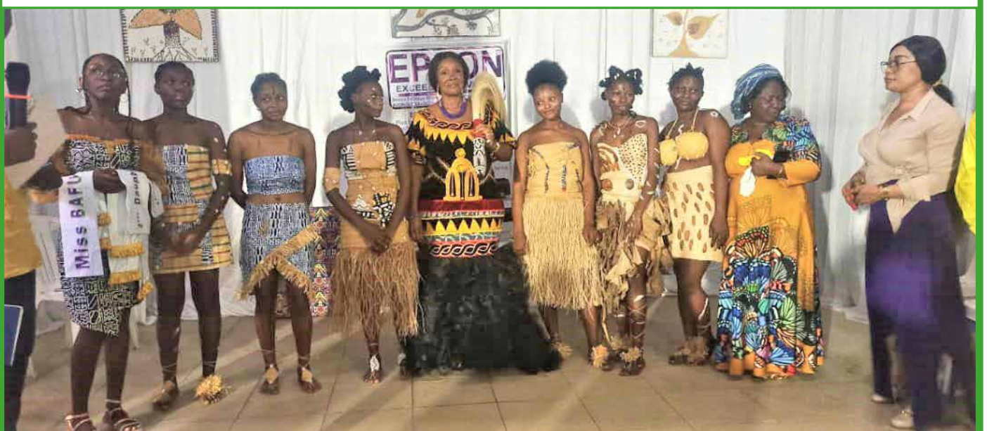
Le maire à la soirée de gala de la jeune fille Bafung à Douala