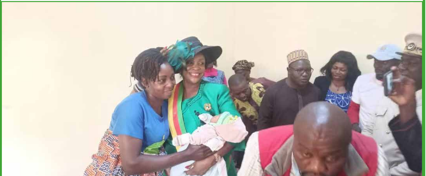
Le Maire au chevet des Mamans et Nouveau-nés du CMA de Babadjou