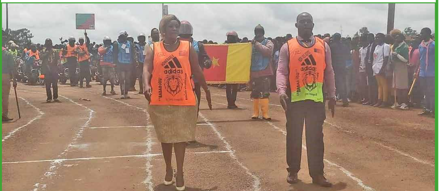
Le Maire ouvrant le bal du défilé des mototaximen exerçant dans la commune de Babadjou un 20 mai