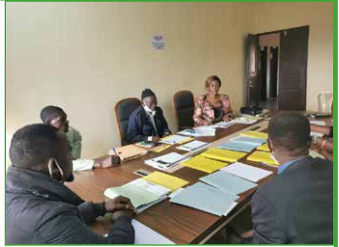
Maturation des projets : Le Maire en action en compagnie de ses services techniques compétents.