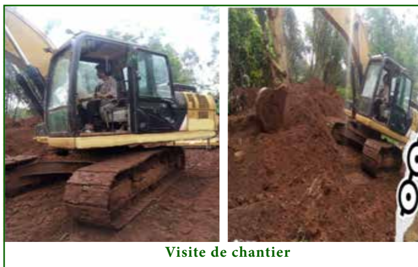
Visite de chantier