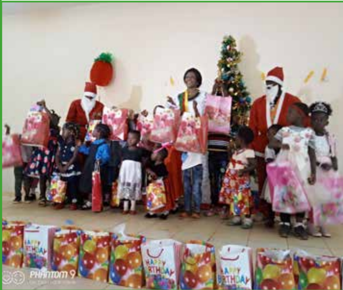
Depuis 2020, la mère le maire a souhaité bonne fête de Noël à environ 1000 tout-petits