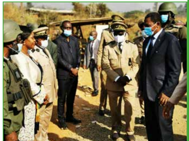
Le Maire auprès du ministre Paul Atanga Nji à Matizam-Babadjou