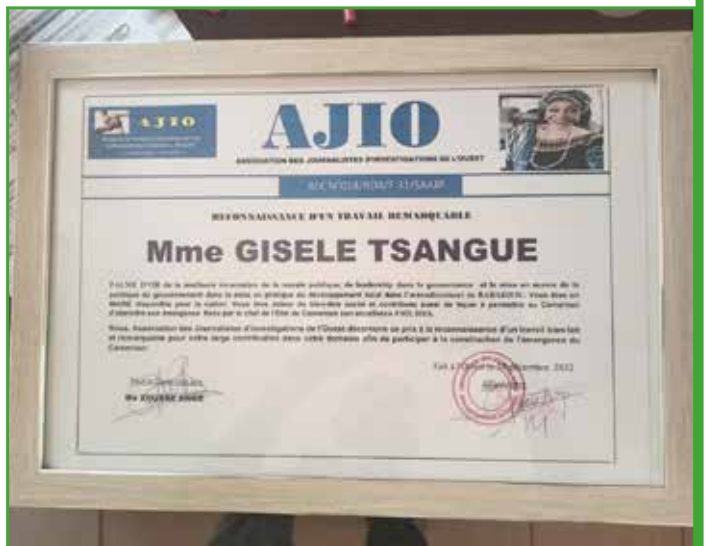
Le travail du Maire de Babadjou récompensé par AJIO (Association des Journalistes d'Investigations de l'Ouest.)