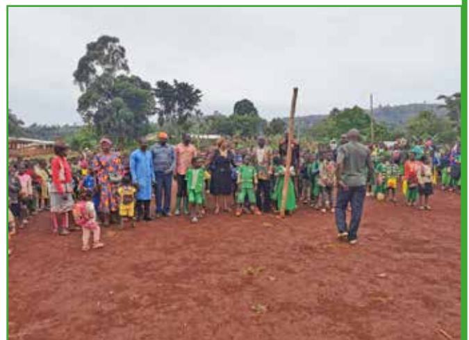
Le maire au complexe scolaire de Bamelo