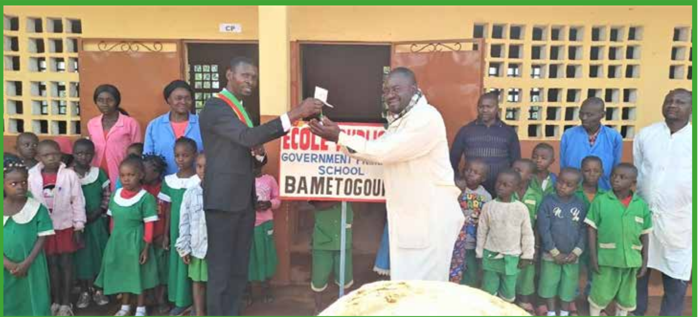
Remise des clés d'un bloc de deux salles de classe en tables - banc a EP de Bametogoung