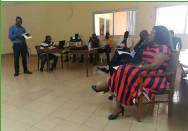
Accès à L'eau potable : le maire fait appel aux experts du domaine