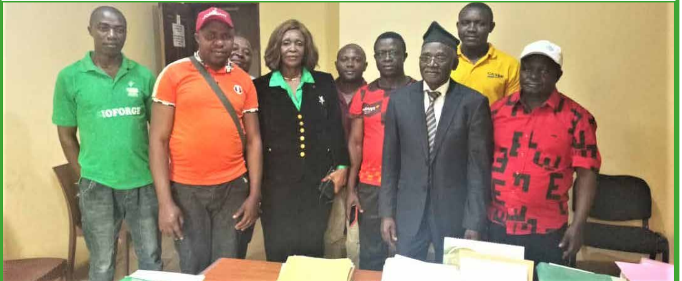
Le maire rencontre le comite de gestion du marché Kombou