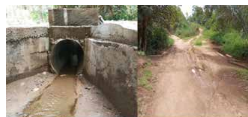
BUSE NOYEE AU VILLAGE BAMEPA'AH