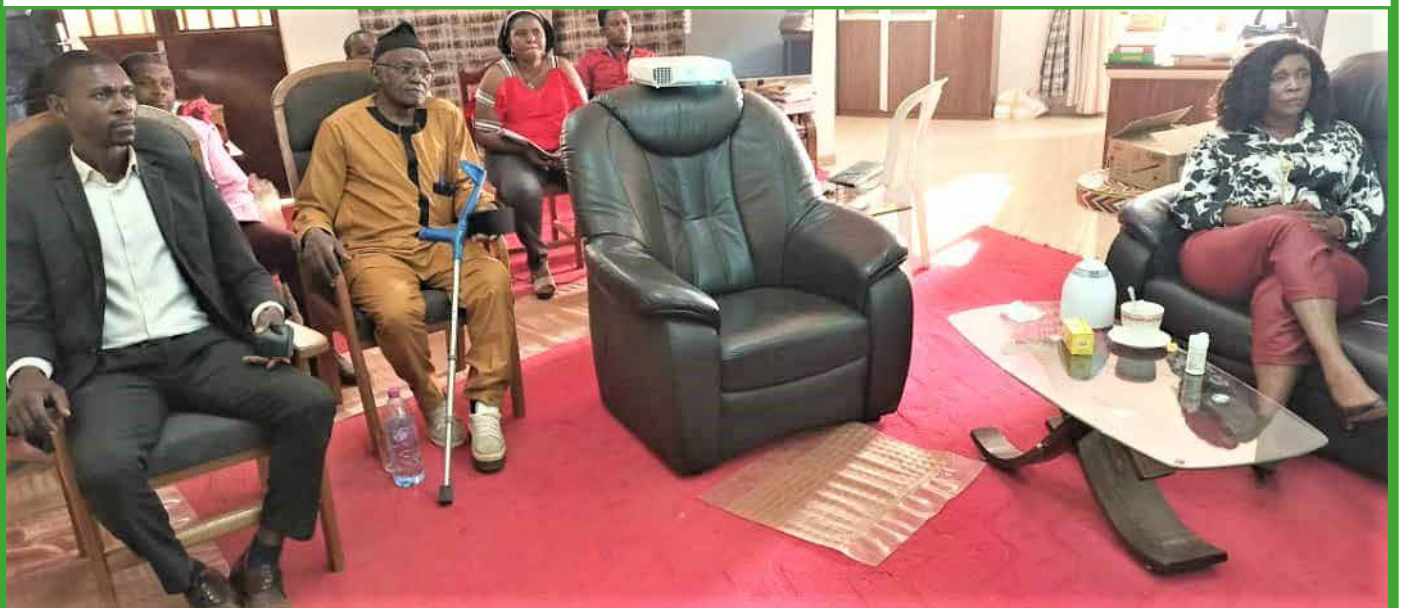
Le travail de l'ensemble, c'est son affaire