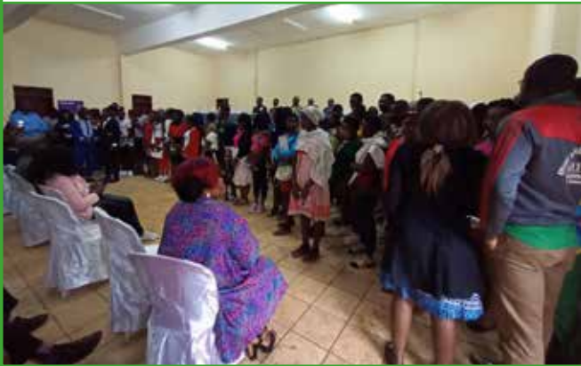
Première Edition de l'excellence Scolaire et estudiantine parrainée par le maire