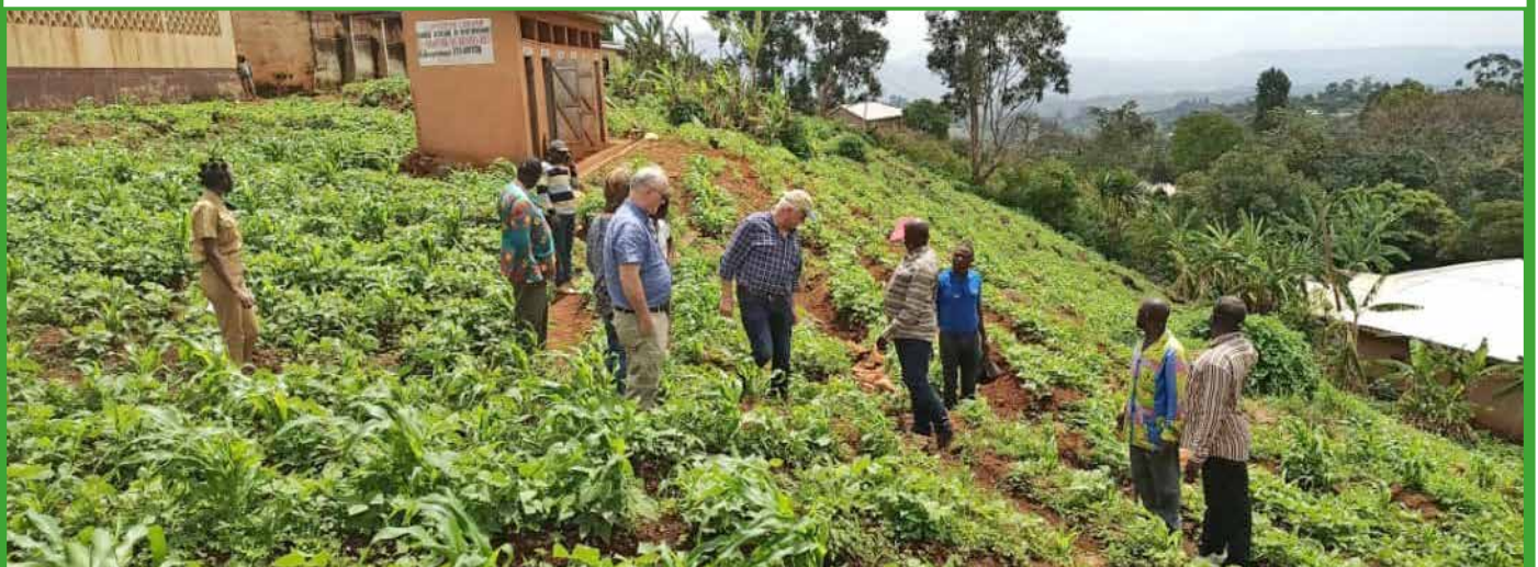
Coopération GIZ-Commune de Babadjou : les experts de la GIZ au pied des monts Bamboutos