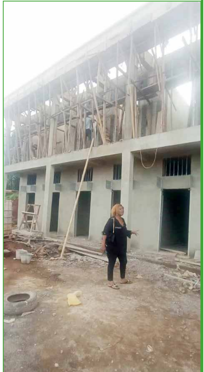
Visite de chantier par le maire au centre commercial de Toumaka