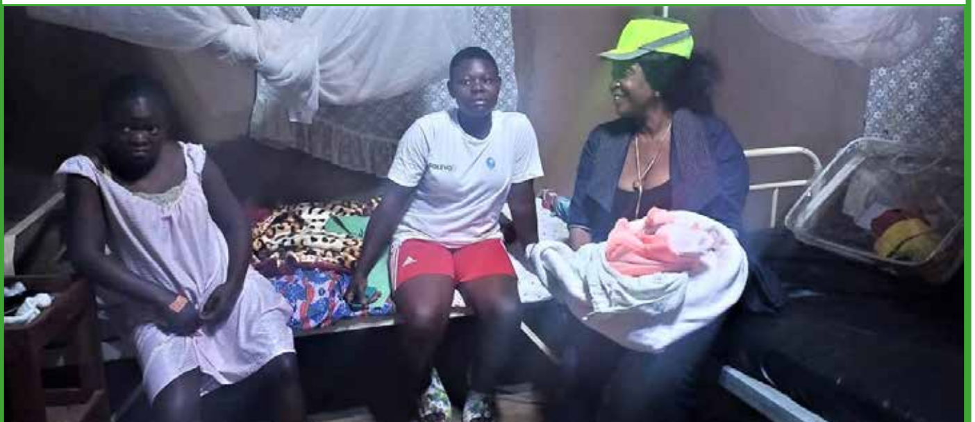
Toujours à faire le tour des hôpitaux pour apporter la chaleur maternelle