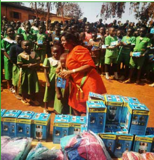
Coopération UNICEF-Commune de Babadjou : projet ECHO : remise des lampes solaires et Matériels didactique aux élevés du CM2 de toutes les écoles publique de la commune de Babadjou