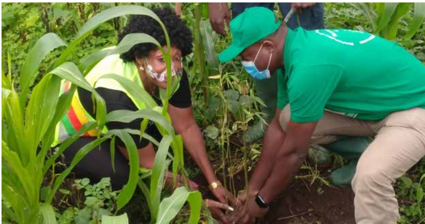
Espace vert et environnement

La deuxième phase de l'Opération ville verte Babadjou vient d'être lancée afin de faire de cette commune un gage de protection environnementale, un bassin d'air pur. Par le passé la Mairie a lancé la phase 1. Ce qui a permis d'aménager la place du cinquantenaire dont les travaux sont achevés