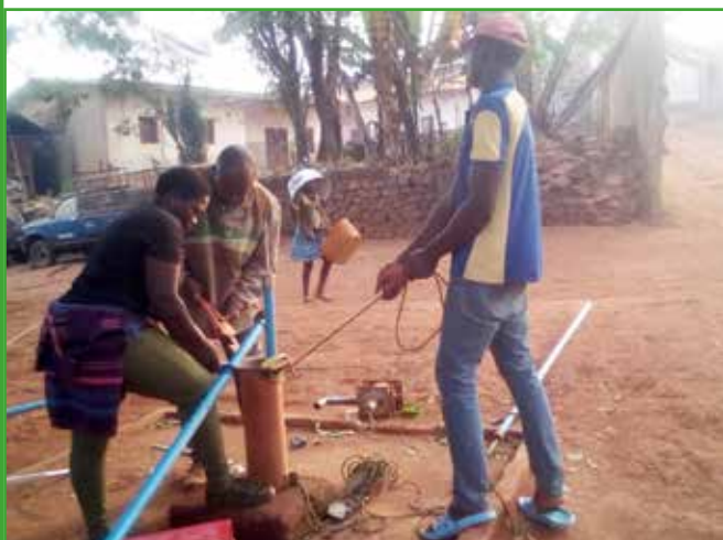
2021 : Réhabilitation du forage de Zavion a Toumaka