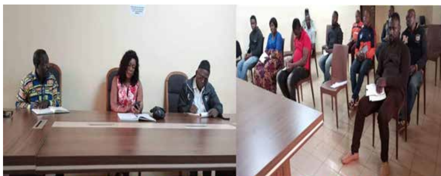
DANS LE FEU DE L'ACTION