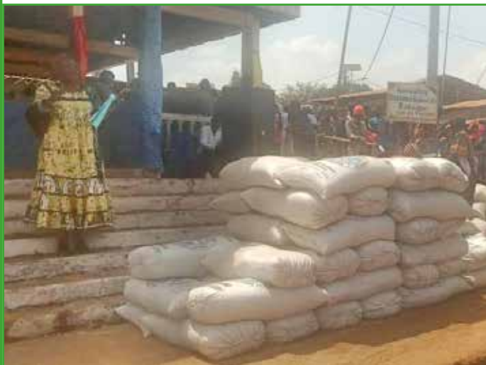
Le Maire distribue 100 sacs de Fientes aux associations de femmes de Babadjou