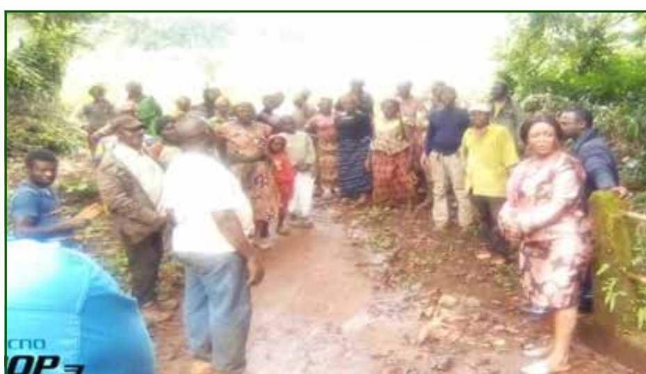
Descente au village Bamegnia pour encourager les populations qui entretiennent les routes