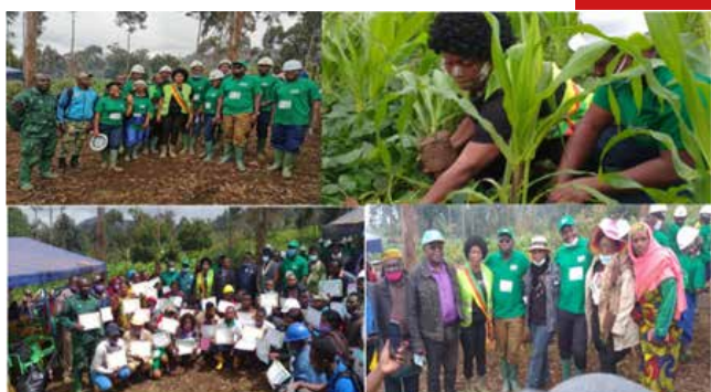
INITIATIVE REBOISEMENT DES MONTS BAMBOUTOS