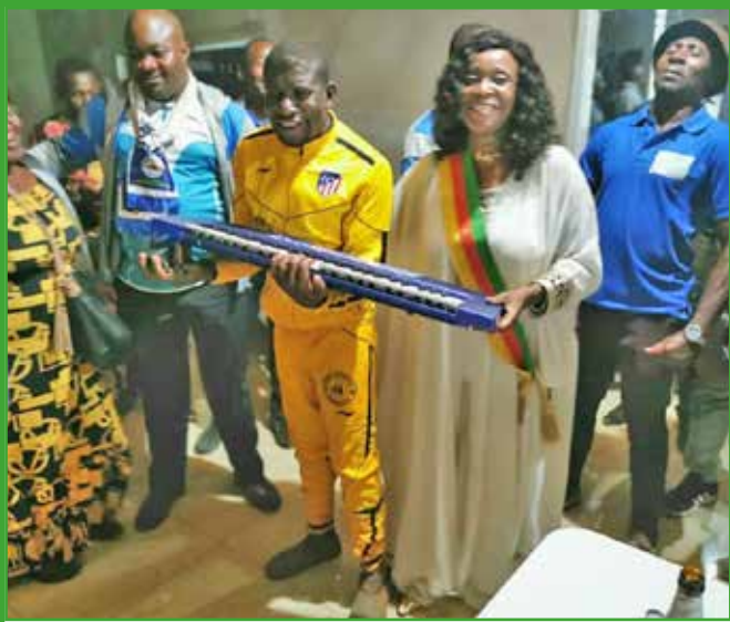
Le Maire offre un piano au «déséquilibré mental» Major