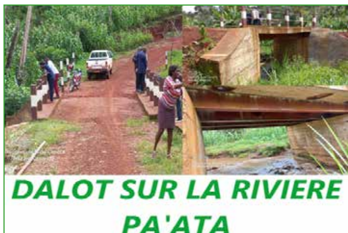
DALOT SUR LA RIVIERE PA'ATA