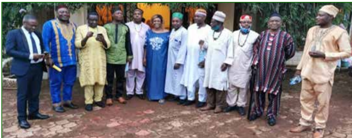
RENCONTRE AVEC LES CHEFS DE 3 ÈME DEGRÉ DU GROUPEMENT DE 1ER DEGRÉ BABADJOU