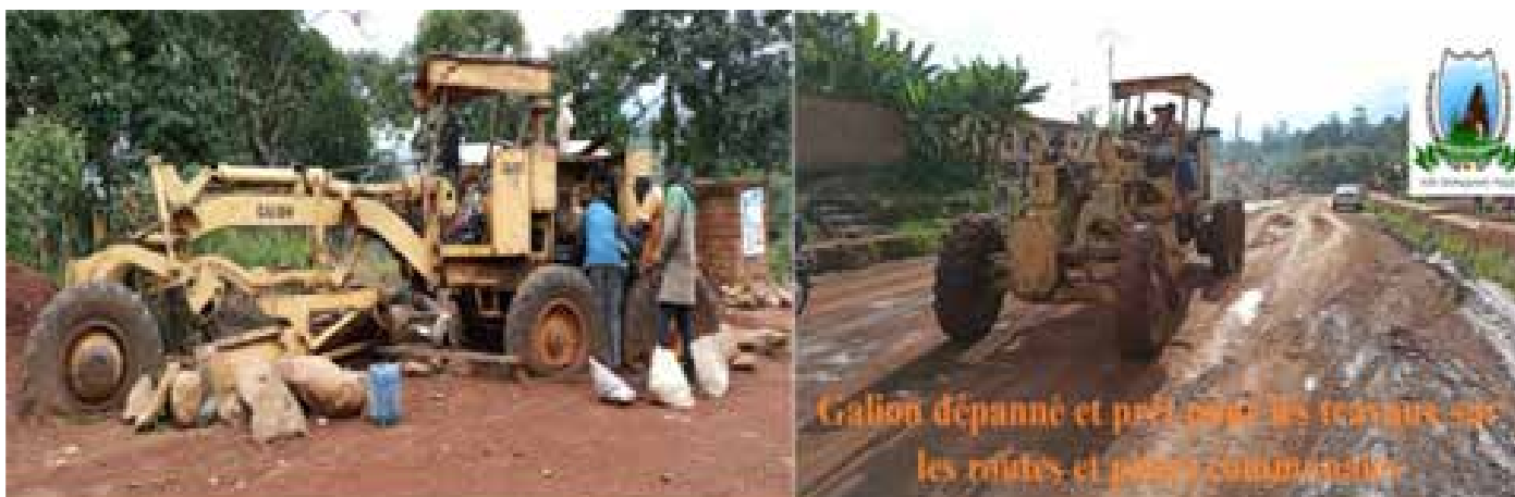
Réparation sur fonds propres de la niveleuse de la Commune de Babadjou