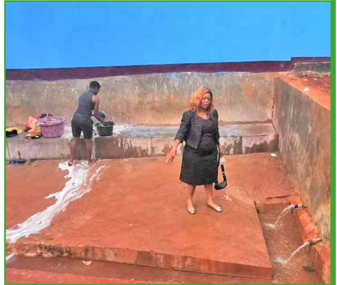
Elle maitrise ses chantiers