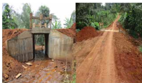
DALOT AU VILLAGE NTOUNGHA