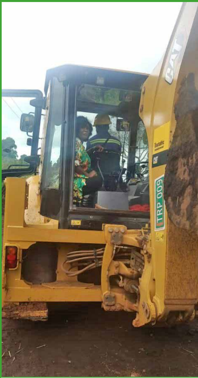
Même dans un Caterpillar si possible