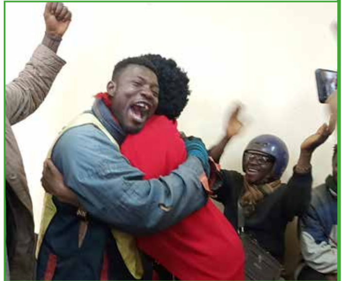
En symbiose avec ses frères, les mototaximen exerçant à Babadjou