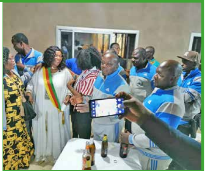
Rencontre Maire - CSB