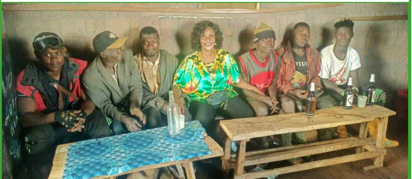
Visite des coins chauds dans les profondeurs de Babadjou