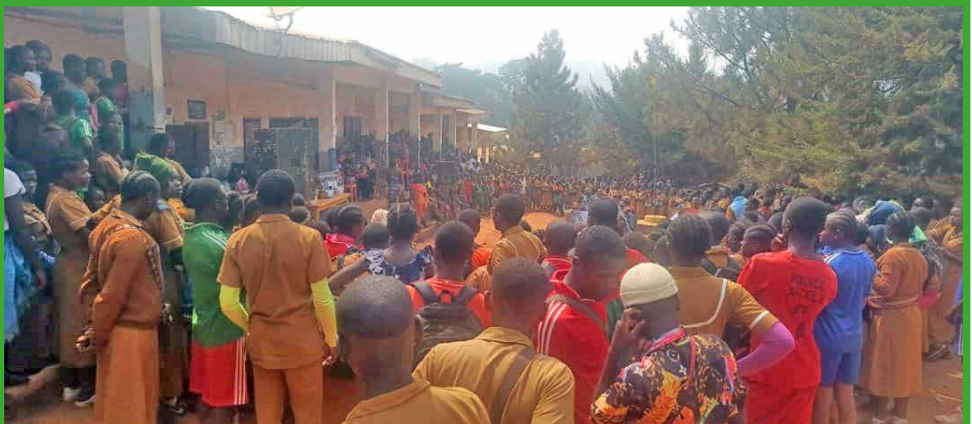
Le Maire assiste à la journée internationale de la langue maternelle au lycée Bilingue de Babadjou