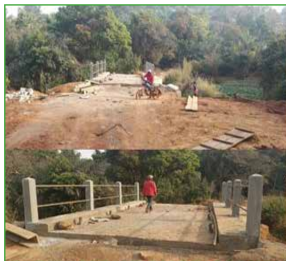
PONT LETOU TAGOUAGNIA