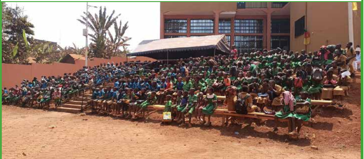
Activités culturelles clôturant les activités de la semaine de jeunesse : l'espace arrière de l'hôtel de ville sert de cadre à cette cérémonie