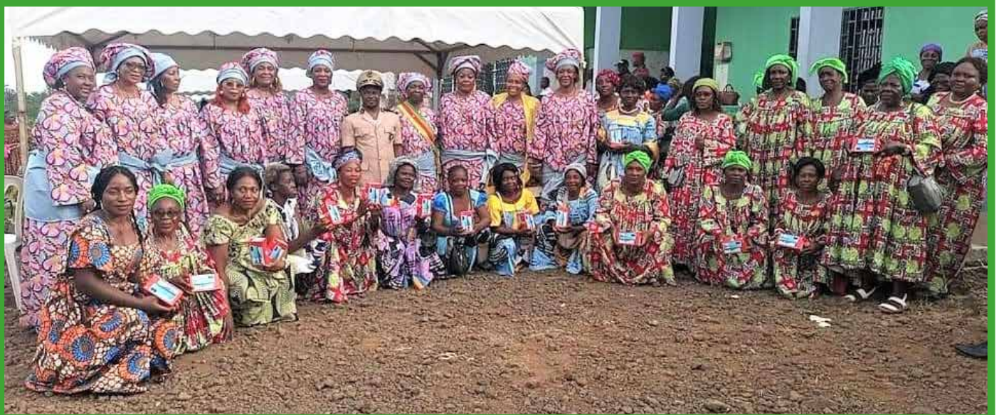
Le Maire honore de sa présence à un atelier de partage de savoir-faire et d'expérience avec ses collègues du SOFEMA (Solidarité femmes Maire) à la commune d'Ebone