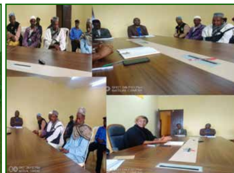
Réunion avec les chefs et leaders issus des 5 villages Bororo de la Commune