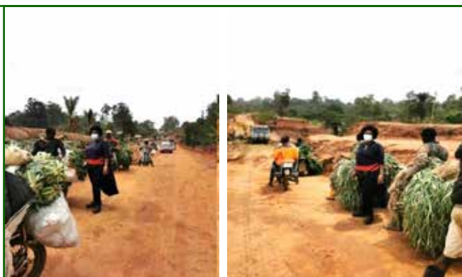
DESCENTE AU VILLAGE BAMEDJI