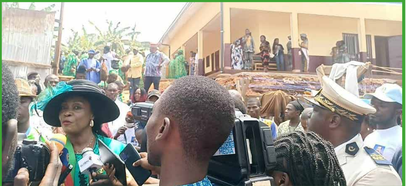
Inauguration du Pavillon Mère et Enfant du CMA de Babadjou