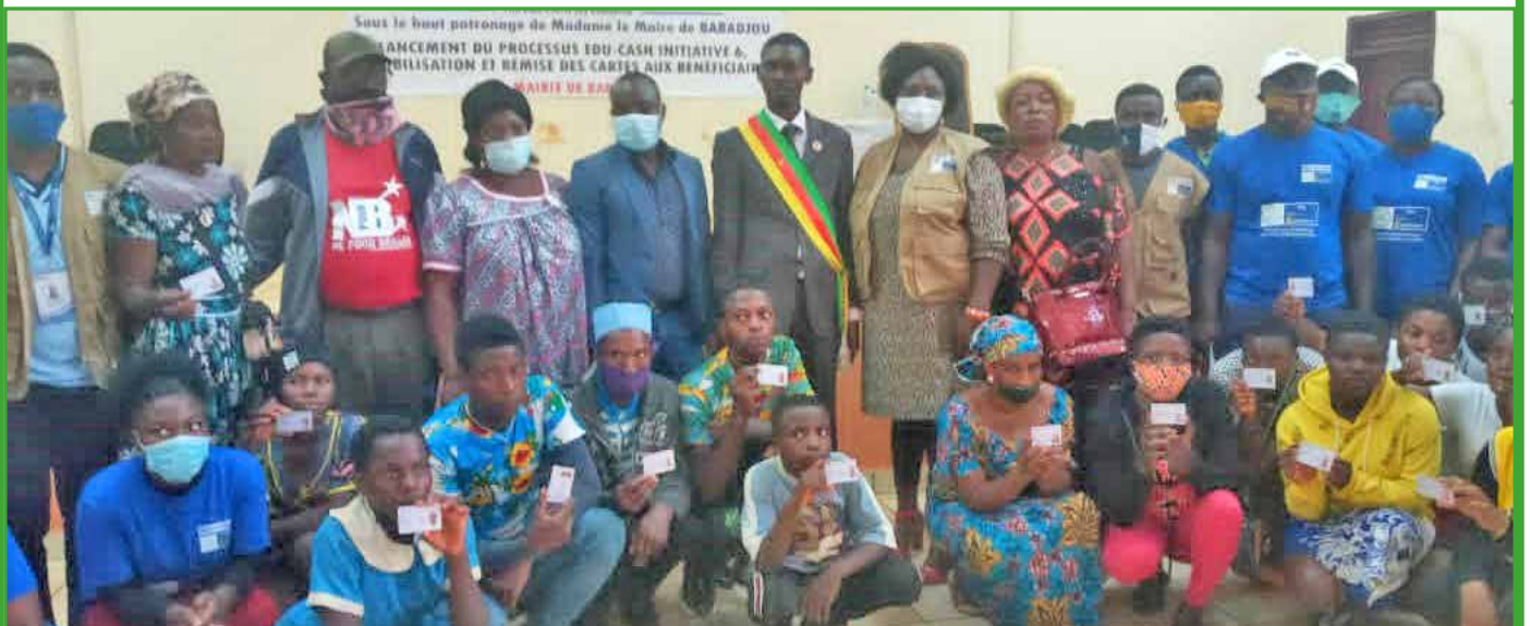
Lancement du project EduCash6