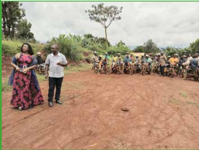
Jour d'examen de passage du permis de conduire entièrement financier par madame le maire au profit des mototaximen exerçant dans la commune de Babadjou