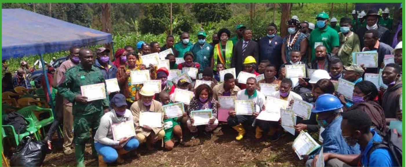
Journée mondiale de l'environnement 2021 : le Maire et les acteurs de protection de l'environnement au pied des Monts Bamboutos