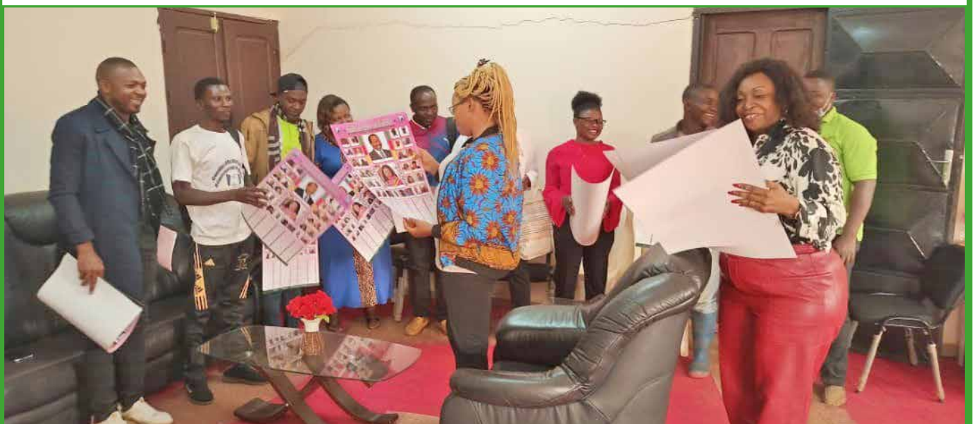
Rencontre avec le CNJC