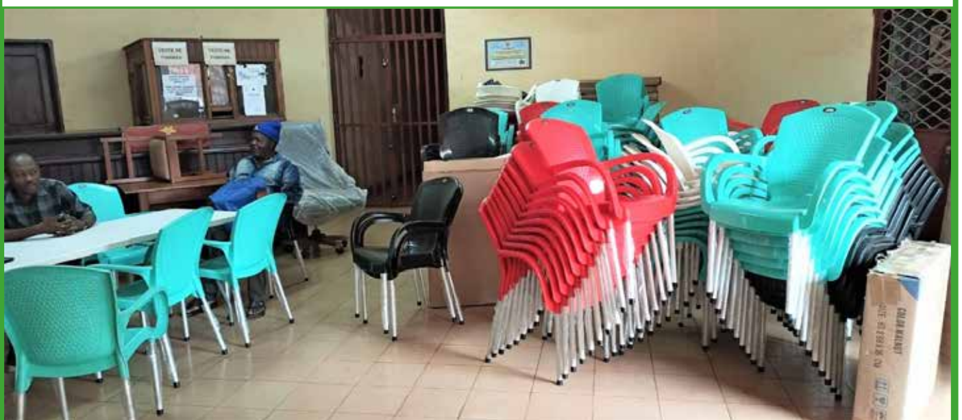
Equipement du foyer communautaire de Babadjou