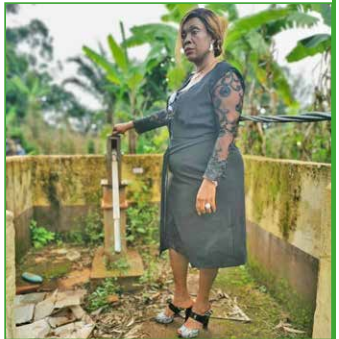
Visite de l'état des infrastructures en eau. Forage a PMH du complexe scolaire de Bamelo